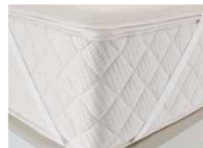
Mit 4 Eckgummis zur Befestigung

Die Steppung einer Matratzenauflage sorgt dafür, dass das Füllmaterial nicht verrutscht und somit eine gleichmäßige Wärmezufuhr und Druckverteilung über die komplette Fläche erreicht wird.